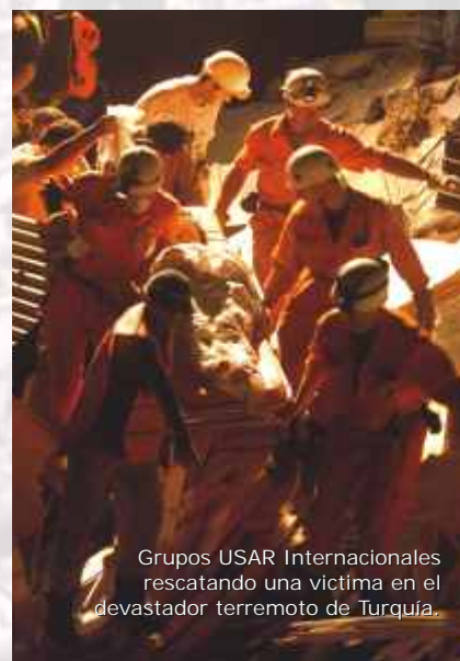
Grupos USAR Internacionales rescatando una víctima en el devastador terremoto de Turquía.

Esperamos los mejores resultados. Creemos firmemente que se está logrando una mejor sinergia en América. Observamos que el apoyo en gestión de riesgos y capacitación es una inversión, y así debe entenderlo la mayoría. Vemos con agrado que hay un acercamiento entre la sociedad civil y los grupos científicos que manejan temas de sismología, hidrometeorología, sustancias peligrosas, y protección de la comunidad ante un desastre. Este esfuerzo es positivo, todos tenemos una responsabilidad en la prevención de los incidentes derivados de la acción humana.