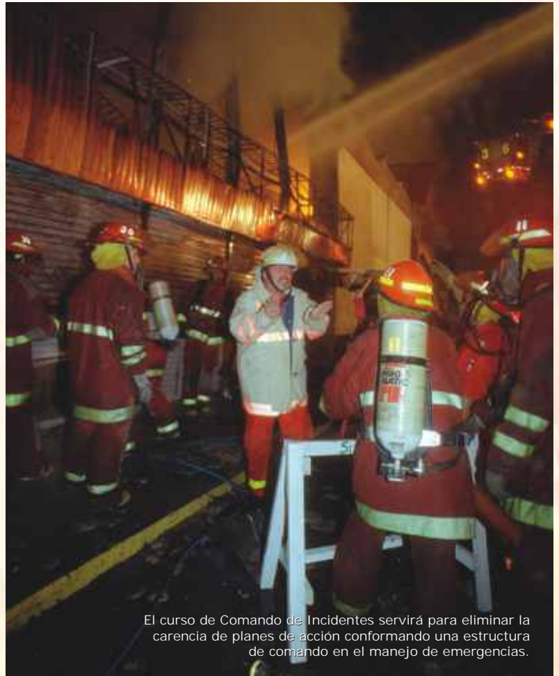
El curso de Comando de Incidentes servirá para eliminar la carencia de planes de acción conformando una estructura de comando en el manejo de emergencias.

El curso explicó que la jefatura del Comando de Incidentes recae sobre una sola persona dentro de la organización, con el auxilio de oficiales de seguridad, de información y de enlace. El Oficial de Seguridad es el elemento más importante, pues determina si la maniobra a realizar es segura. Otros integrantes del Comando de Incidentes son las secciones de Operaciones, Planificación, Logística y Finanzas, que se ponen en acción dependiendo de la magnitud de la emergencia. Al finalizar, los participantes recibieron un maletín de Puesto de Comando, para su pronta implementación y ejecución.