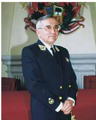
TULIO NICOLINI AYARZA Brigadier General CBP COMANDANTE GENERAL