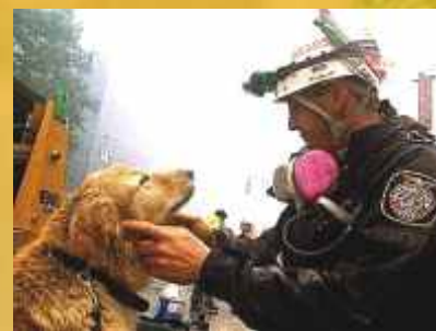
El empleo de canes adiestrados en Búsqueda y Rescate es fundamental en los grupos USAR.